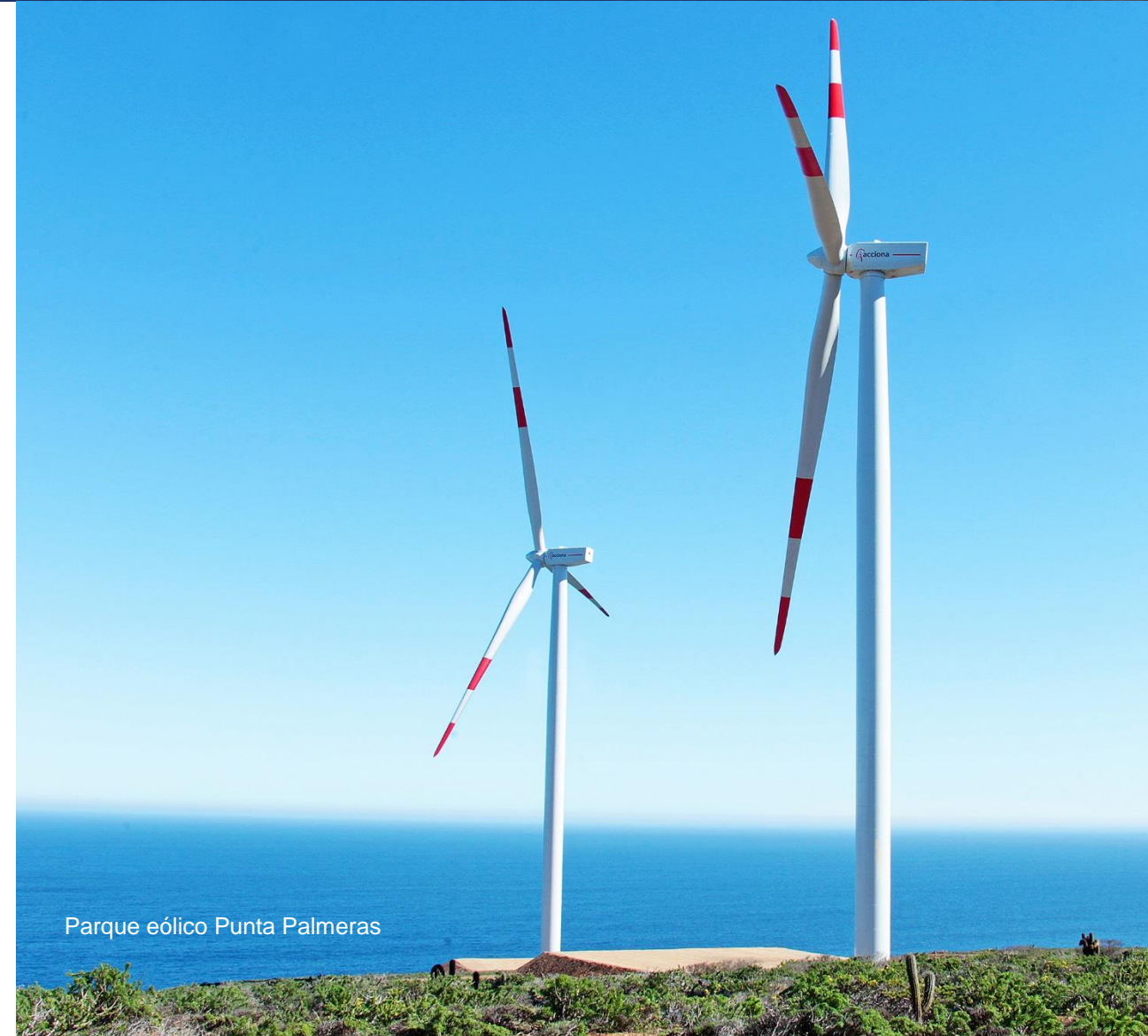
Parque eólico Punta Palmeras